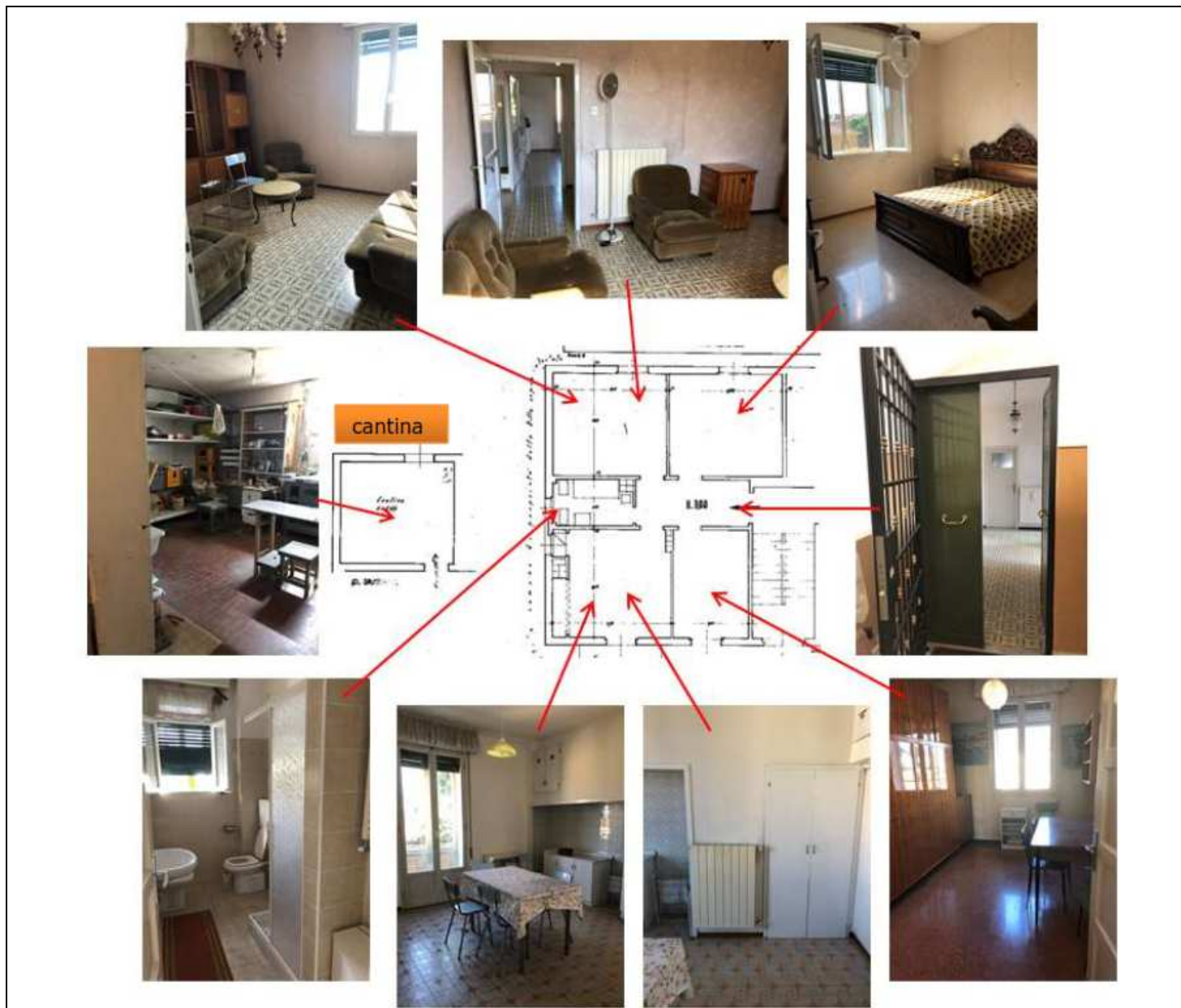
Foto 3 - Interni