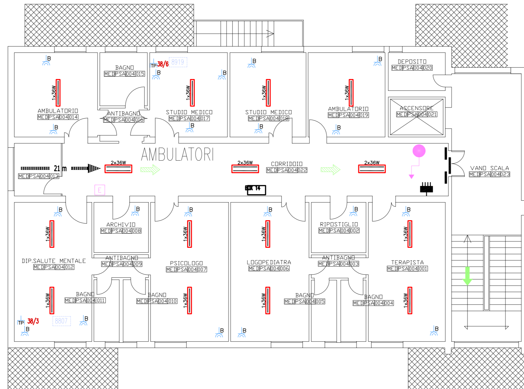
PIANTA PIANO SECONDO - SCALA 1:100